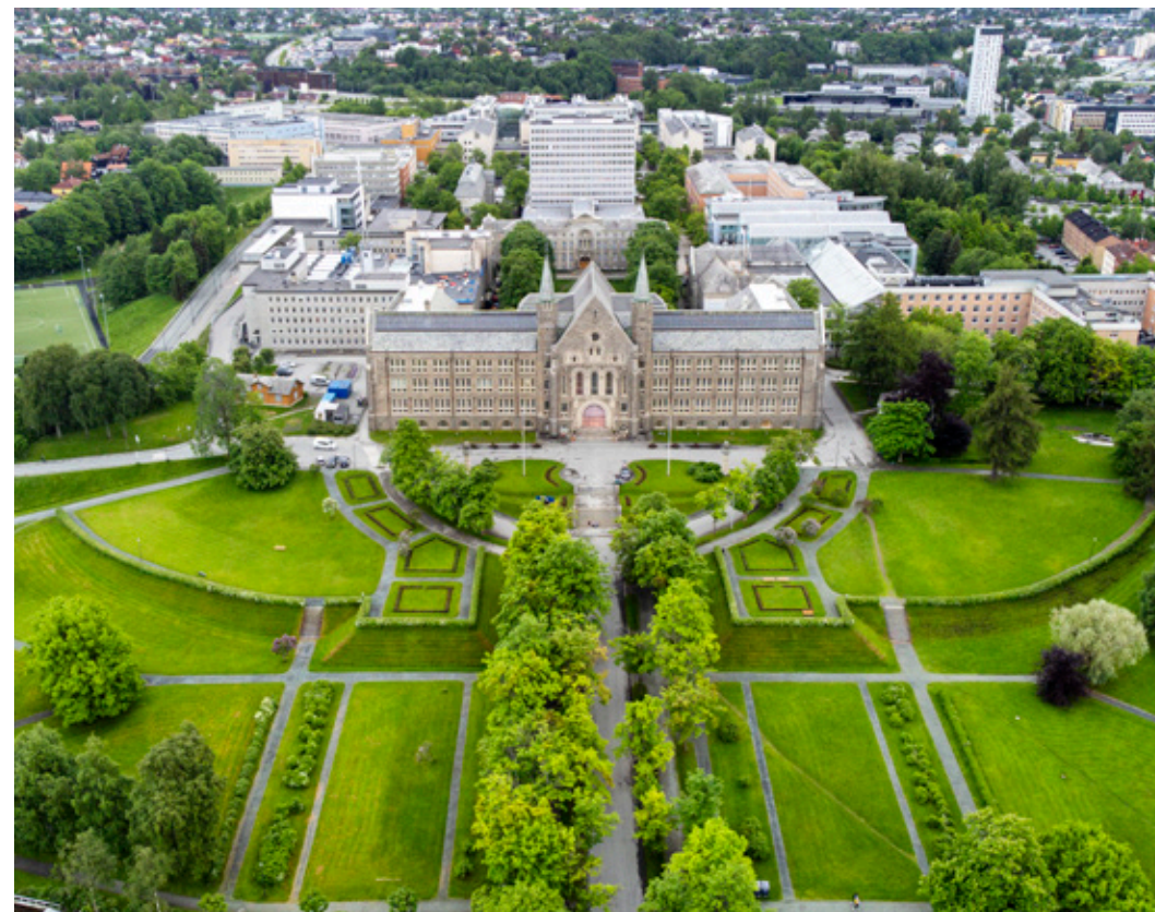
NTNU, Norges teknisk-naturvitenskapelige universitet.

Flere fremmede stater benytter også ulike økonomiske virkemidler for å få tilgang til sensitiv teknologi og informasjon om norske forhold. Aktiviteten omfatter blant annet investeringer i selskaper og oppkjøp av eiendom. Denne aktiviteten er ikke nødvendigvis ulovlig, men kan i visse tilfeller brukes for å nå