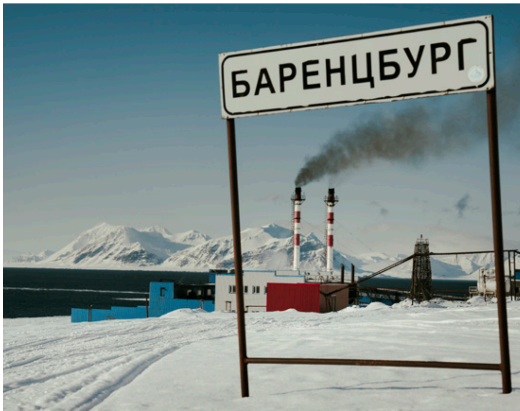
Skilt ved ankomst Barentsburg.