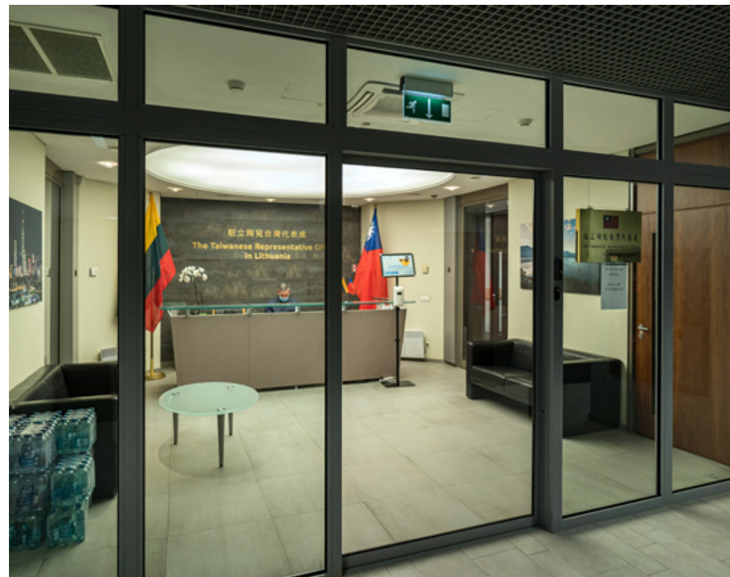
Taiwans representasjonskontor i Vilnius, Litauen.

PST observerer at flere europeiske land de siste årene har blitt utsatt for press og trusler fra Kina, som ønsker å endre eller påvirke disse landenes beslutninger. Kina vil fortsette å utnytte økonomisk avhengighet og bruke sine etterretningstjenester til å ramme land de er i diplomatisk konflikt med.