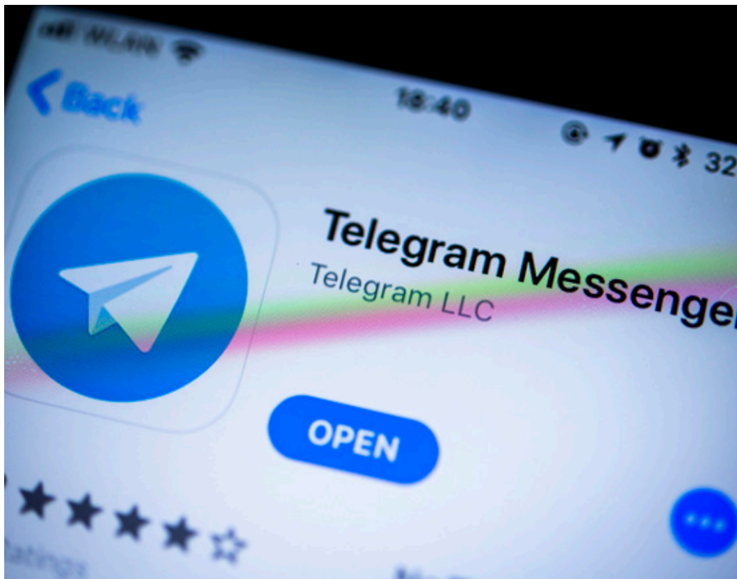
Telegram Messenger, Instant Messenger App.