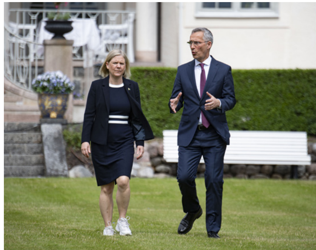
Sveriges tidligere statsminister Magdalena Andersson (S) og Natos generalsekretær Jens Stoltenberg møtes på Harpsund for å diskutere Sveriges medlemssøknad i Nato.

For Russlands sivile og militære industri er vestlig teknologi ettertraktet. I tidligere år kunne russisk industri i større grad anskaffe dette lovlig. I 2023 vil det utvidede sanksjonsregimet og de skjerpede eksportrestriksjonene øke Russlands behov for vestlige varer, teknologi og tilhørende kunnskap. PST forventer derfor at Russland vil gjennomføre skjulte og fordekte anskaffelsesforsøk i og via Norge i inneværende år.